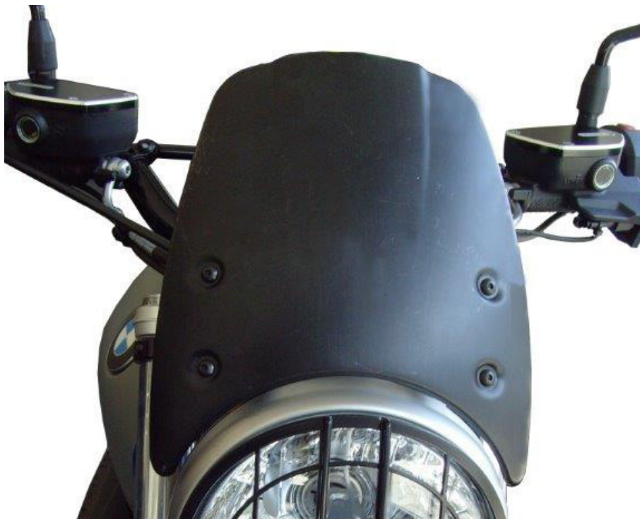
Windschild, Typ ZBW081