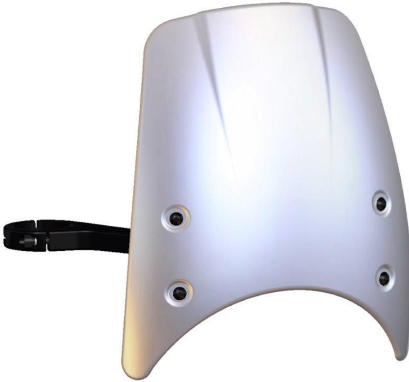
Windschild, Typ ZBW081