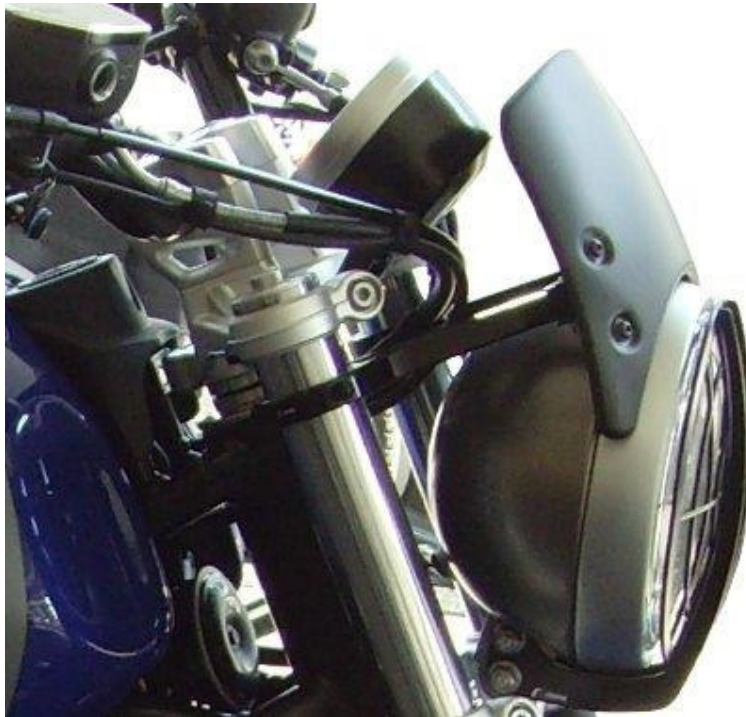
Windschild, Typ ZBW077