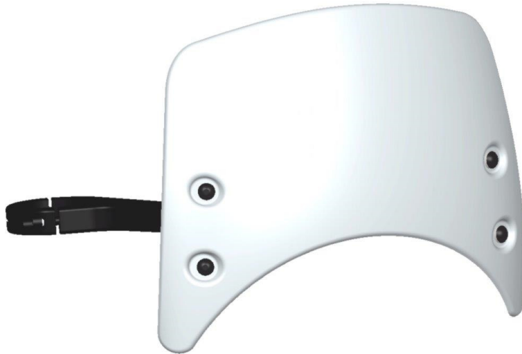
Windschild, Typ ZBW077