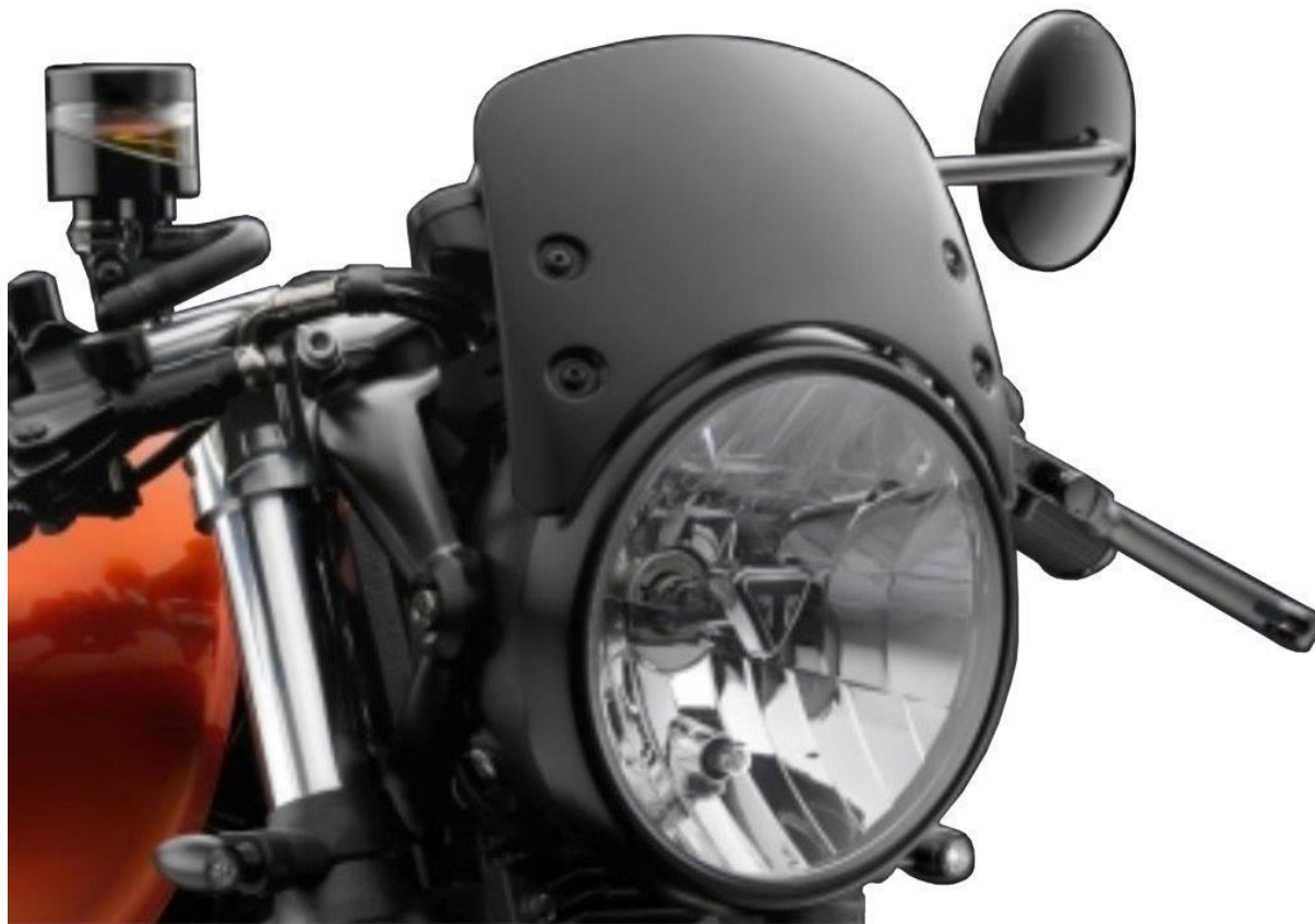
Windschild, Typ CF011