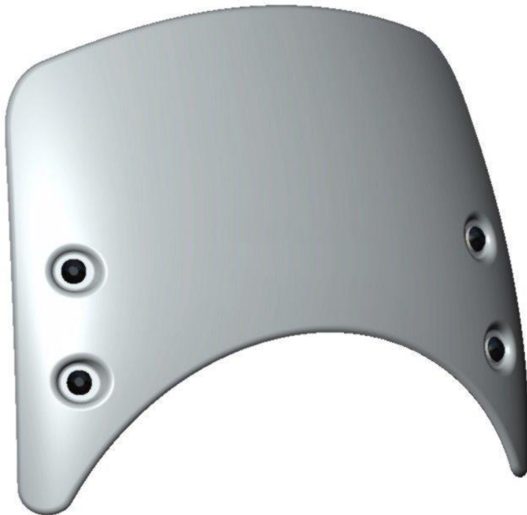
Windschild, Typ CF011