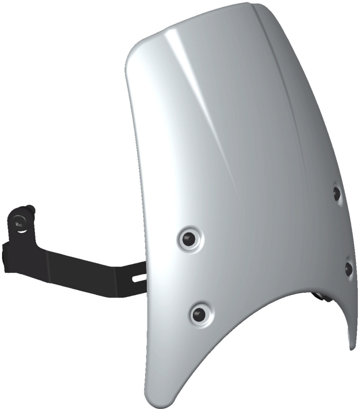
Windschild, Typ ZBW042, Ausführung 2