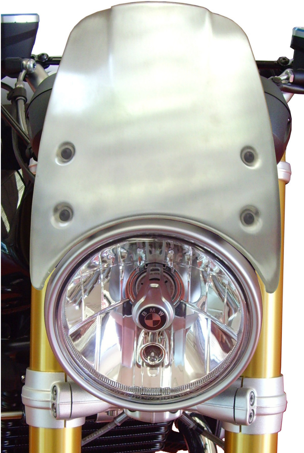
Windschild, Typ ZBW042, Ausführung 2