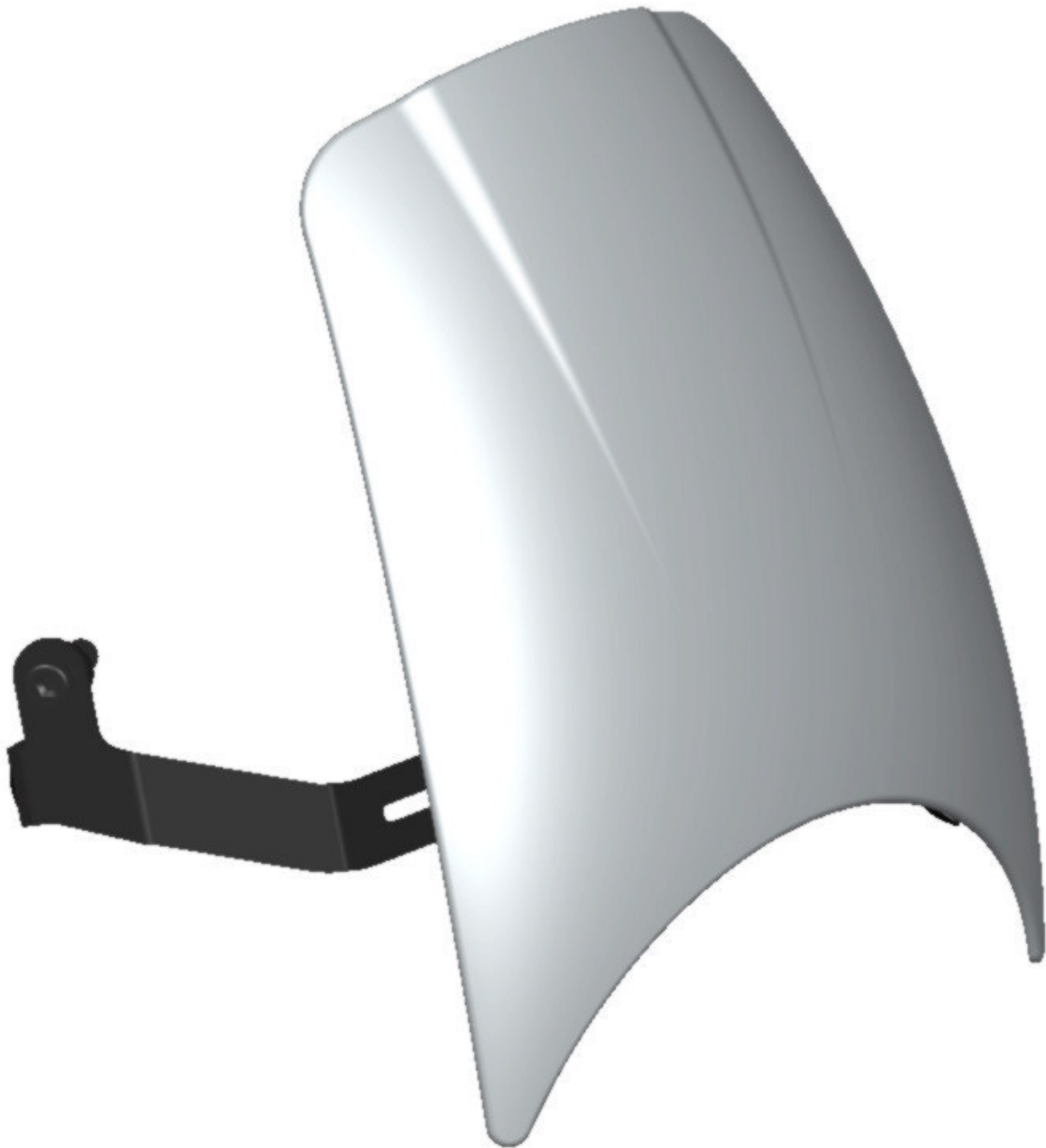
Windschild, Typ ZBW042, Ausführung 1