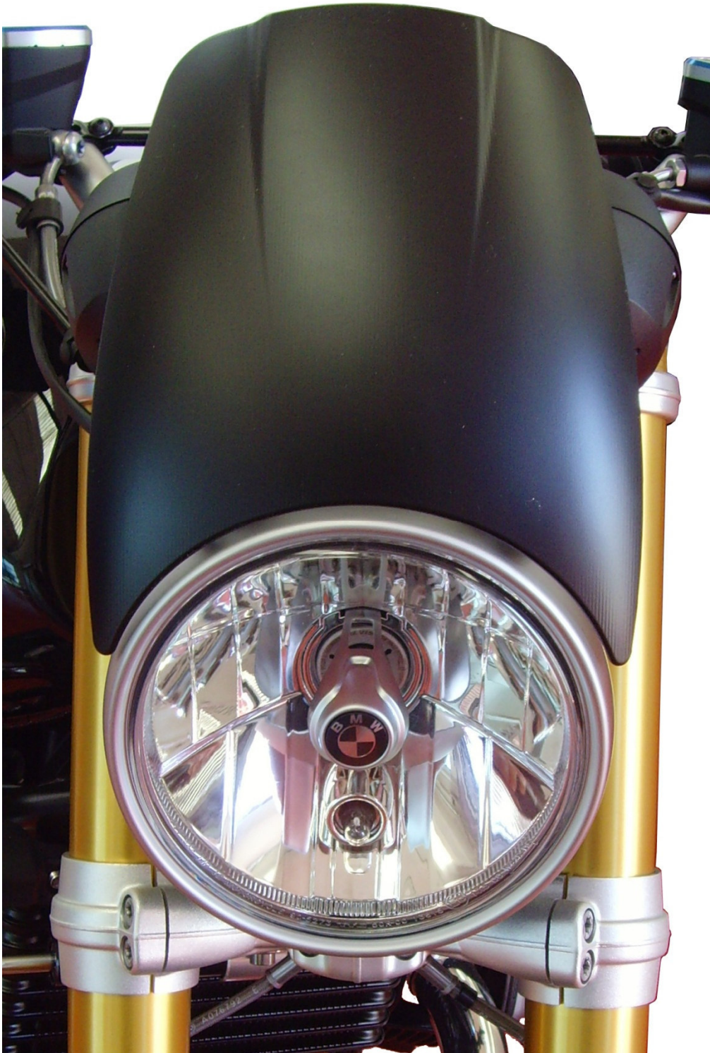
Windschild, Typ ZBW042, Ausführung 1